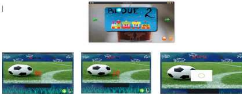
Figura 2 Bloque2 “sílabas”, se muestra la imagen con la animación de las sílabas Fuente(s): Ángeles Alcantara, 2018

La segunda actividad o bloque 2 (Figura 2) se enfoca al manejo de sílabas, se selecciona un video el cual aparecerá la primera imagen sobre la que se trabajará por ejemplo la palabra “pelota” esta se separará por sílabas, las cuales se escucha el sonido de cada una de ellas y la animación como en la actividad uno, solo que en esta sección se anima la sílaba completa para que sea reconocida por el usuario, finalmente se completa la palabra completa la cual se emite el sonido correspondiente. Además, en esta sección existe un recuadro en la parte inferior para que el niño escriba la sílaba, y si es correcta se emite un sonido motivador para proceder con la siguiente sílaba, de lo contrario se pide al usuario que lo intente nuevamente.