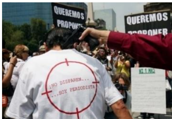
Imagen 1 Soy periodista...

La estructura narrativa de guerra presente en esta imagen, con la consigna “¡NO DISPAREN... SOY PERIODISTA!” se encuentra reforzada con dos consignas más que bien podrían evocar una tregua, “QUEREMOS PROPONER”, y detener el número de víctimas: “Ni 1 más”. Así, las tres consignas funcionan como anclaje de la imagen y de la narrativa.