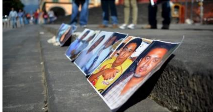
Imagen 10 En la orilla de la banqueta

podría aludir a una de sus prácticas frecuentes de periodistas, sobre todo de publicaciones diarias o de varias ediciones al día, para la obtención de información: la llamada entrevista “banquetera”. En el argot periodístico se refiere una breve entrevista o declaración obtenida o arrancada , regularmente por un grupo de periodistas, al arribo o a la salida de un personaje a un determinado lugar (ver Imagen 11).