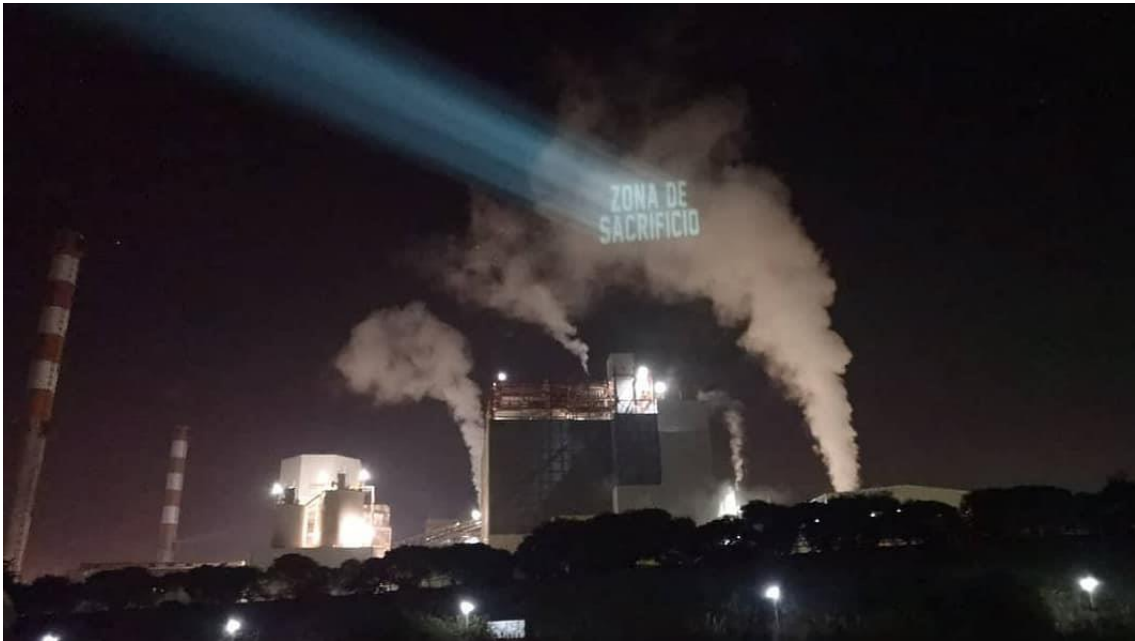
Imagen 2 Lumínica de DelightLab en Ventanas

No es que tengamos una agenda, así como vamos a hacer esto tal día por esto, o sea obviamente si pasa algo muy importante decimos, oye igual podríamos hacer algo porque está pasando esto, pero desde que empezamos hacer las lumínicas, desde la idea de Camilo Catrillanca y de las intervenciones que hicimos, más medio ambientales, nos han estado llamando mucho 30 .