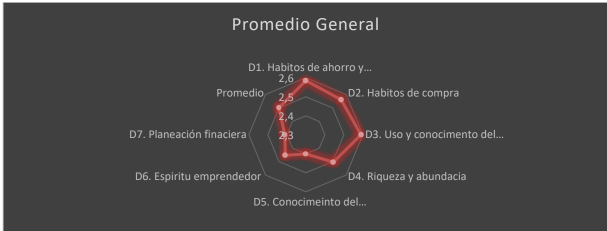
Gráfica 1 Promedios generales por dimensión