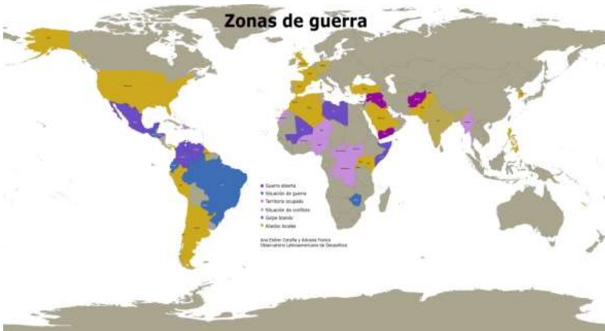
Mapa 1 Zonas de Guerra

No obstante, aunque esa es una pista que es necesario observar con cuidado por la complejidad que involucra, la ruta más evidente para establecer la lógica de las guerras o de los desplazamientos y expansión territoriales parece seguir el camino de los “recursos”, de las riquezas que brinda la naturaleza y que tienen su arraigo geográfico específico. Una revisión cuidadosa de las áreas en guerra o conflicto durante la última década muestra una puntual coincidencia con las rutas de la búsqueda de recursos, como puede observarse en los siguientes mapas.