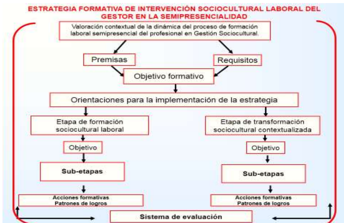
Figura 1 Estrategia formativa de intervención sociocultural laboral del gestor en la semipresencialidad