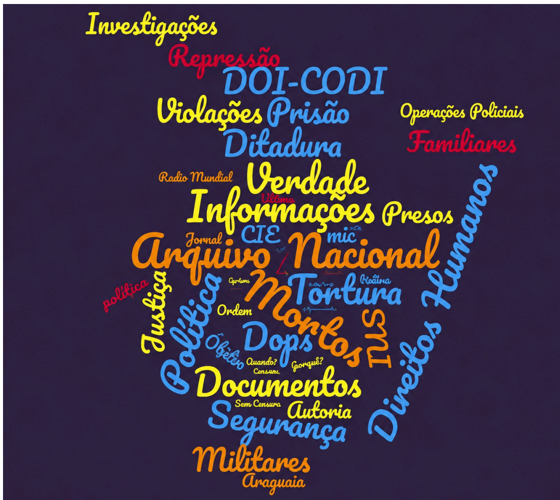
Figura 1 – Nuvem de palavras da Coleção I