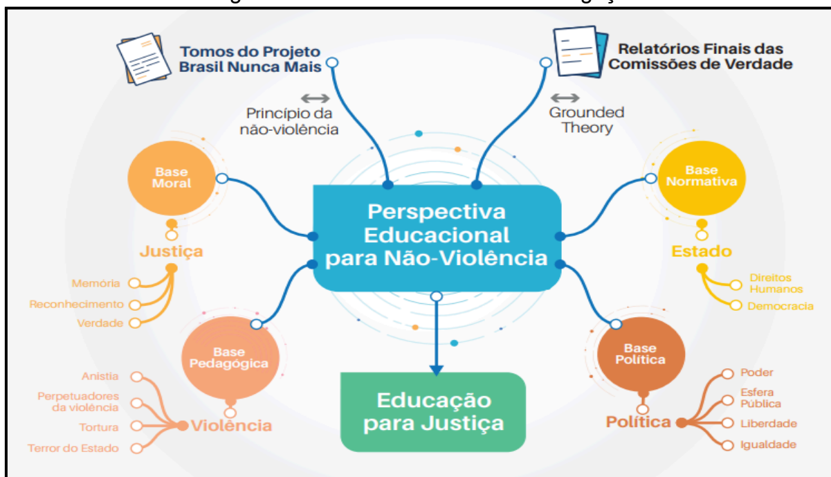
Figura 6 – Panorama Geral da Investigação