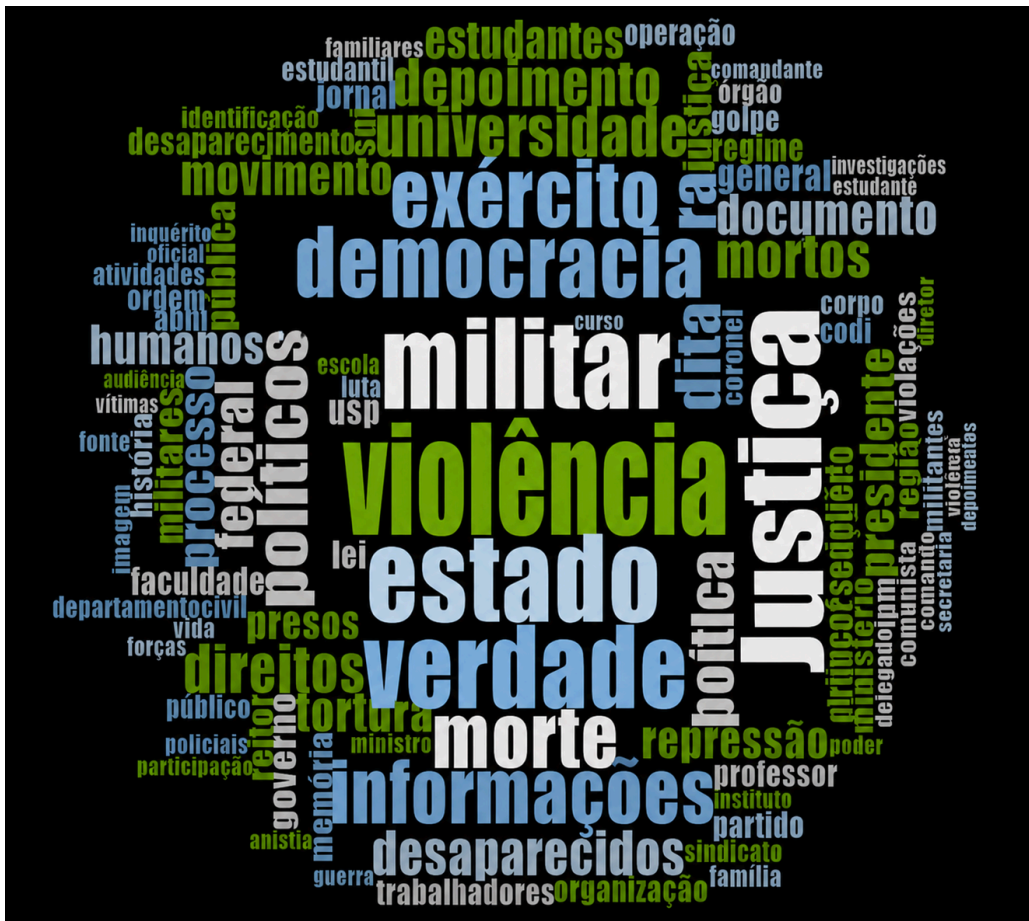
Figura 2 – Nuvem de palavras do conjunto de coleções