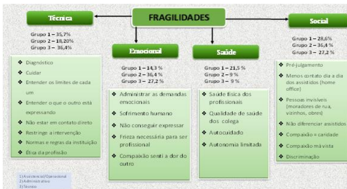
Figura 3 Limitações ou fragilidades elencadas pelos participantes das oficinas foram relacionadas com questões técnica, emocional, saúde e social.

interpretação do que o outro está expressando e os limites de cada um. A comunicação com o paciente pode envolver expressões verbais ou não-verbais, sendo a verbal aquela realizada por meio de palavras expressas tanto linguagem escrita quanto por falada, e deve ser clara a fim de que o outro compreenda o que se pretende dizer 34 . A comunicação não-verbal ocorre quando se interage com outro com ou sem a utilização de palavras, sendo que esta interação possui significados para o emissor e para o receptor 35 . É realizada através de expressões faciais, gestos, pela maneira como os objetos estão dispostos no ambiente ou por posturas corporais, por exemplo. A comunicação não-verbal tem por finalidades básicas complementar o verbal, substituí-lo, contradizê-lo ou demonstrar sentimentos. Contudo, nem sempre é possível utilizar a comunicação verbal, neste sentido, entende-se a importância de o profissional atentar para os sinais não-verbais, e interpretá-los, pois, estes sinais complementam o que é expresso verbalmente, oferecendo subsídios para compreender melhor o outro.