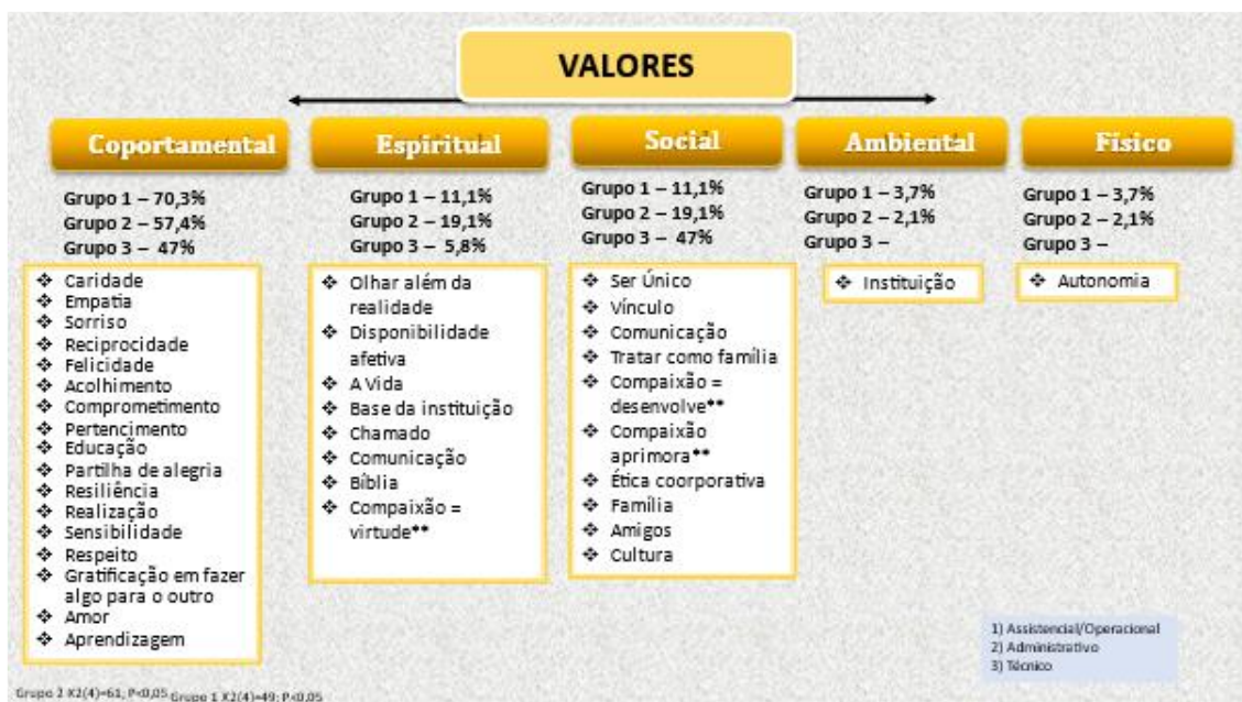
Figura 5 Categorização dos valores demonstrados pelos participantes das oficinas.

O cuidado profissional às pessoas com deficiências foi evidenciado pelas profissionais de enfermagem no estudo de Lago et al 55 que relataram que o cuidar de pessoas com deficiência física é especial, requer paciência, carinho e proximidade, destaca-se como essencial a comunicação, o contato físico e a troca de “experiências” na convivência. Os autores complementam dizendo que este cuidado às pessoas com deficiência física não se limita a um cuidado técnico, mas ao reconhecimento dos modos como elas se expressam. Entendem que o profissional, neste contexto, aprende um modo particular de interação e de cuidar, que ressignificam seu trabalho, sua vida e o crescimento profissional e pessoal são evidenciados, ficando claro o prazer que possuem em trabalhar, e enxergam como sendo uma troca de experiência. No entanto o cuidado do profissional a estas pessoas também é marcado pelo despreparo, pois, ao longo do tempo, a sociedade costumava segregar esses indivíduos por considerá-los inválidos 56 .