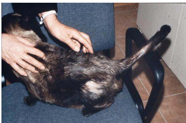
Figura 2 41

Na figura 2 está demonstrado um exemplo de como o estresse pode ter reflexos nas dermatopatias crônicas e excesso de higiene, necessitando de uma análise minuciosa do caso.