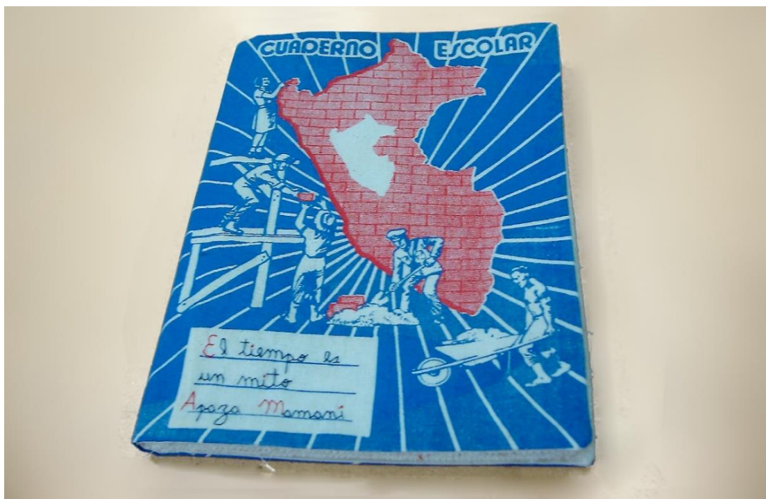
Figura 2. Cuaderno objeto de la artista.

Para el análisis pre-iconográfico o formal, se puede apreciar el cuaderno objeto, en la figura 2 que muestra los siguientes elementos: un objeto tridimensional de medidas 23 cms. de alto por 18 de ancho x 1.5 cms. de alto aprox que nominalmente es un cuaderno escolar para escritura. Presenta una carátula con los siguientes colores: azul cobalto y rojo bermellón o cadmio. En el objeto, la imagen predominante es un mapa geográfico del Perú republicano compuesto por un conjunto de ladrillos de color rojo en su contorno interior; dentro del mismo, otro mapa de menor tamaño y de color blanco como simbolizando el blanquirrojo de la bandera nacional.