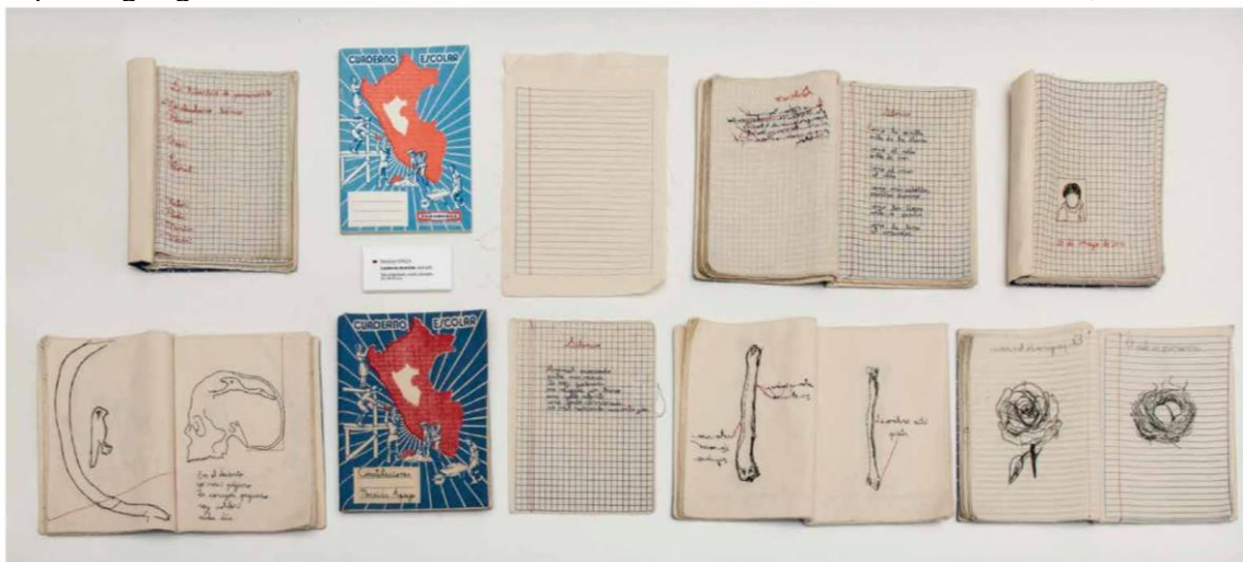
Figura 1. Conjunto de cuadernos de artista (2013-2019) en la exposición de artes visuales.